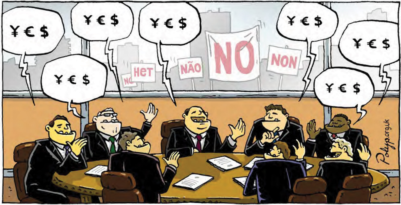
by Polyp (Permission for use issued to La Via Campesina in 2018) More at www.polyp.org.uk

និយាយរួម វាកំពុងតែផ្តល់ឱកាសឱ្យក្រុមហ៊ុនកសិពាណិជ្ជកម្មមានសិទ្ធិដែលឥតព្រំដែន ក្នុងការកំណត់នូវអនាគតនៃប្រព័ន្ធស្បៀង អាហាររបស់ពួកយើង ដោយគ្របដណ្តប់ដោយគោលនយោបាយសាធារណៈ ប្រឆាំងទៅនឹងគោលការណ៍ប្រជាធិបតេយ្យ។ ហេតុដូច្នេះ ពួកយើងមិនអាចទទួលស្គាល់កិច្ចប្រជុំកំពូលស្តីពីប្រព័ន្ធស្បៀងអាហារនៅក្នុងឆ្នាំ ២០២១នេះ ថាជាវេទិកា រដ្ឋាភិបាលពហុភាគីស្របច្បាប់មួយ ដែលអនុញ្ញាតឱ្យមានការចូលរួមស្វ័យភាពពីសំណាក់សង្គមស៊ីវិលនោះទេ។ ដំណើរការ ទាក់ទងនឹងកិច្ចប្រជុំកំពូលស្តីពីប្រព័ន្ធស្បៀងអាហារនេះ ក៏បានបង្ហាញយ៉ាងច្បាស់ពីការកើនឡើងនូវការជ្រៀតជ្រែកពីសំណាក់ ក្រុមហ៊ុនសាជីវកម្មនៅក្នុងស្ថាប័នអង្គការសហប្រជាជាតិសំខាន់ៗមួយចំនួន។