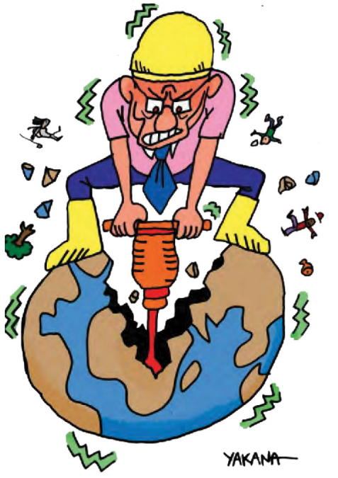
ការទាញយកផលលប់លរ

ក៏ប៉ុន្តែ ដំណើរការកិច្ចប្រជុំកំពូលរបស់អង្គការសហប្រជាជាតិស្តីពីប្រព័ន្ធ ស្បៀងអាហារនៅក្នុងឆ្នាំ ២០២១នេះ មានចរិតលក្ខណៈកើតចេញពីការ ចាប់ផ្តើមដោយមិនមានតម្លាភាព និងគ្មានការចូលរួម។ កាលពីពេលមុន អង្គការស្បៀងអាហារ និងកសិកម្មរបស់អង្គការសហប្រជាជាតិ (FAO) បាន កោះប្រជុំកំពូលស្តីពីស្បៀងអាហារពិភពលោក (WFS) នៅឆ្នាំ ១៩៩៦ និង